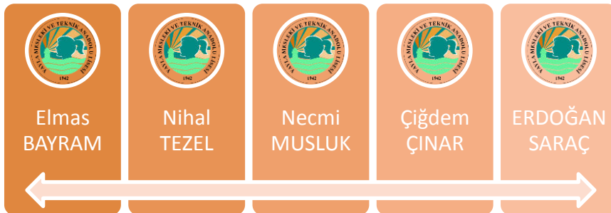
Tablo 14: Organizasyon Yapısı