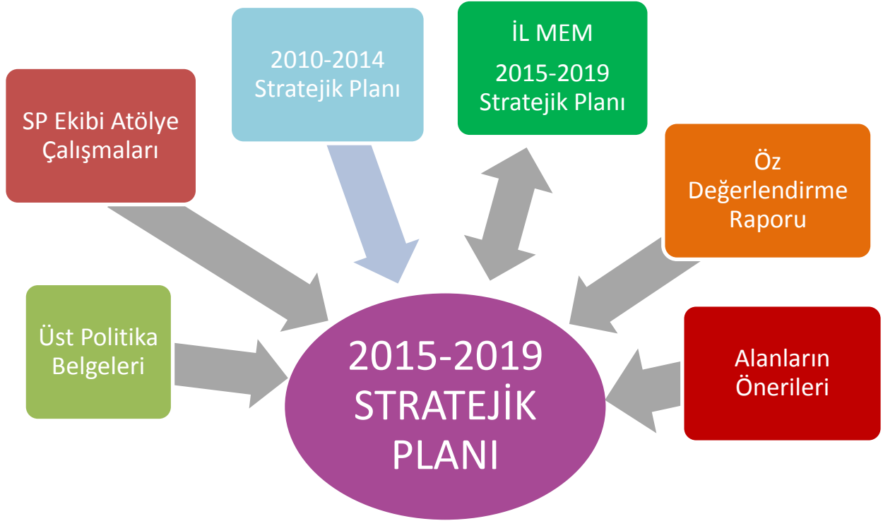
Tablo 4: Stratejik Planımızın Oluşum Şeması

Stratejik plan temel yapısı Müdürlüğün Stratejik Planlama Üst Kurulu tarafından kabul edilen İl Milli Eğitim Müdürlüğü Vizyonu temelinde eğitimin üç temel bölümü (erişim, kalite, kapasite) ile paydaşların görüş ve önerilerini temel alır nitelikte oluşturulmuştur.